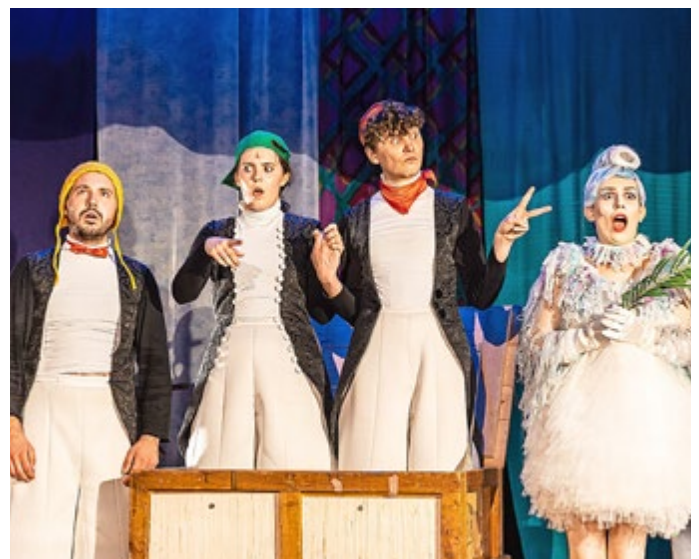
Als Wiederaufnahme im Spielplan 23/24: „An der Arche um Acht“