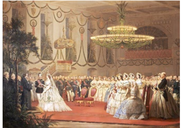
Hochzeit Prinzessin Auguste von S.-Meiningen - Prinz Moritz von S.-Altenburg, Schlosskirche 1862