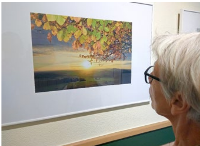
Natur - mal anders, so waren die stimmungsvollen Fotografien übersprochen, die berühren, man muss sie auf sich wirken lassen.