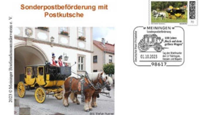
Karte Sonderpostbeförderung mit Marke